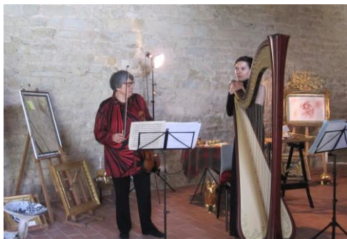
Exposition-concert Une harpe et un violon dialoguent avec des artisans d'art au Manoir de Crémel à Monceaux-en-Bessin (2018)