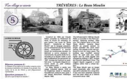
Exemple de panneau d'interprétation