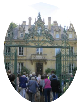
Mon Village se Raconte à Carcagny (2020)