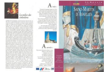
Le Bessin, églises au cœur