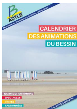
Calendrier des animations du Bessin