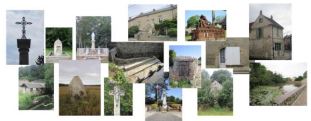
Inventaire du petit patrimoine CdC Orival (2015)