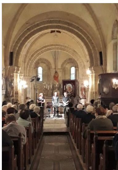
Concert avec l'Ensemble Pantagruair - Église de Sully (2020)