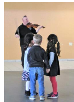
Initiation au bal folk avec les Bons Voisins - École de Ver-sur-Mer (2017)