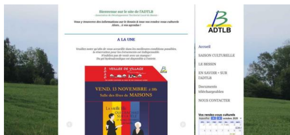
Site internet de l'ADTLB