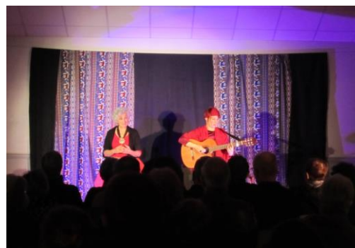
Veillée de Village Landaland - Salle polyvalente de Cormolain (2018)